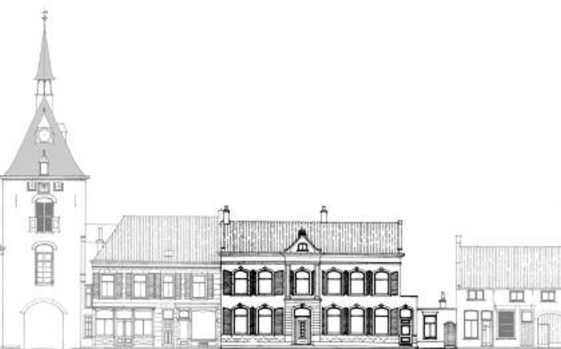
Langendijk 8 - Vianen